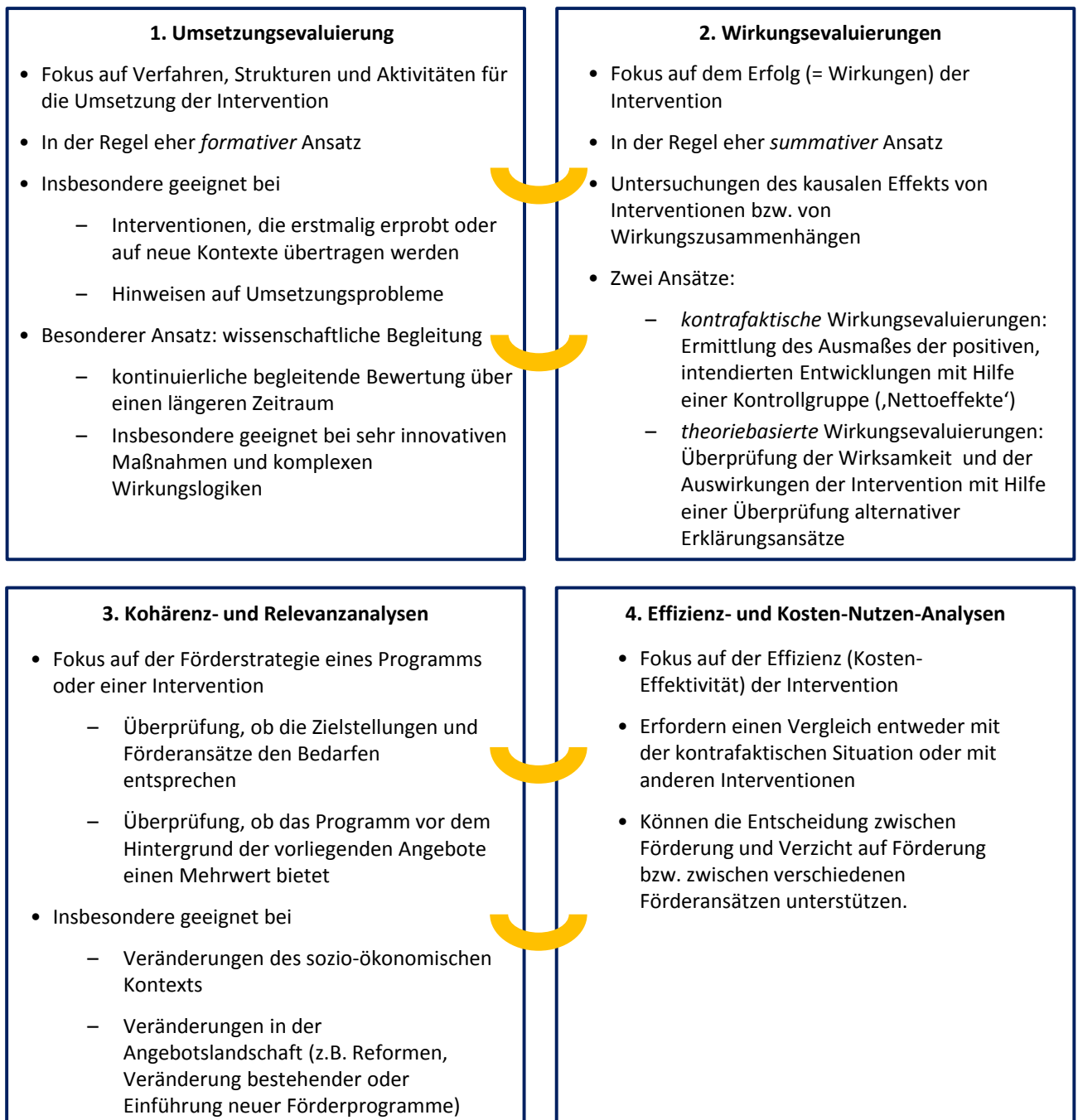
Abbildung 4: Überblick über Bewertungsansätze

Für die Bewertung der Umsetzung, Wirksamkeit, Auswirkungen, Strategie und Effizienz auf Programmebene sowie auf Ebene einzelner Prioritätsachsen oder gar Maßnahmen kommen grundsätzlich folgende Bewertungsansätze in Frage: