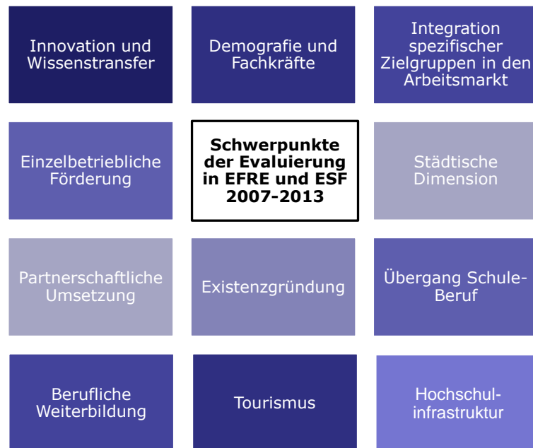
Abbildung 3: Überblick über die thematischen Bewertungsschwerpunkte in EFRE und ESF in der Förderperiode 2007-2013